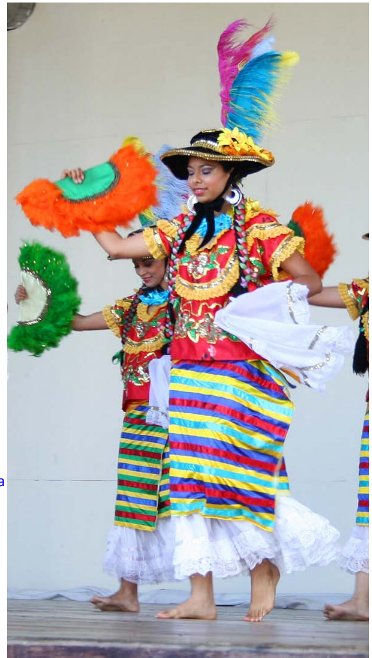
Las bailarinas Mestizaje